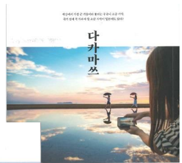
エアソウル機内誌 「YOUR SEOUL」