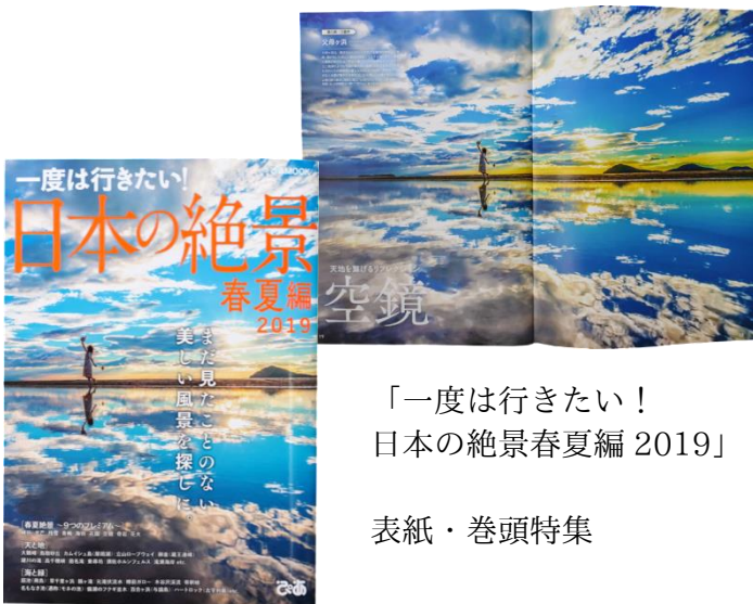
「一度は行きたい！ 日本の絶景春夏編 2019」