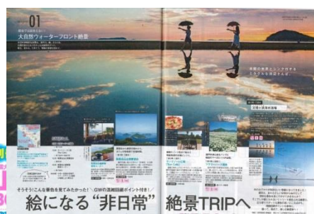
「関西・中国・四国 じゃらんGWおでかけ」