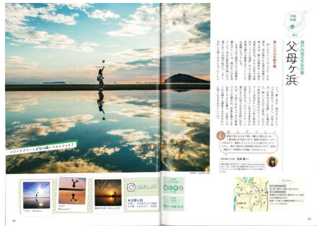
「奇跡に出会う、日本の新絶景」 表紙・巻頭・内面特集