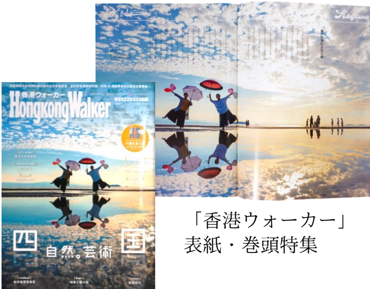
「香港ウォーカー」 表紙・巻頭特集