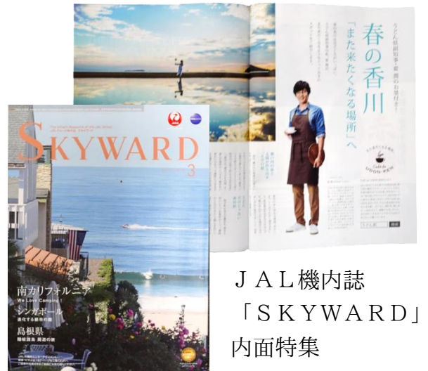
JAL機内誌 「SKYWARD」 内面特集