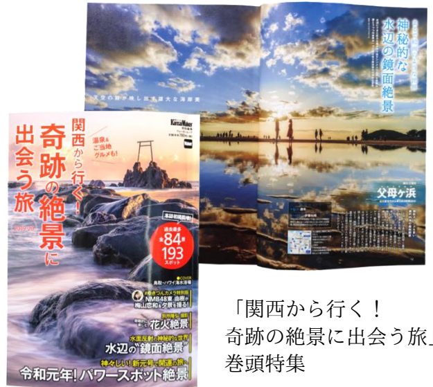
「関西から行く！ 奇跡の絶景に出会う旅」 巻頭特集