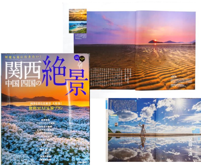
「関西 中国四国の絶景」巻頭特集