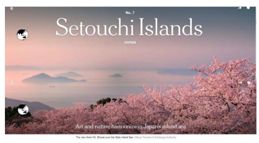
米国ニューヨークタイムズ 「2019年世界で訪れるべき52カ所」 に「瀬戸内の島々」がランクイン。 代表写真として父母ヶ浜付近に位置する 「紫雲出山」の桜の写真が掲載