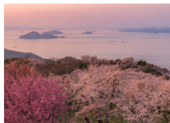
夕暮れの山頂展望台(2023年3月)