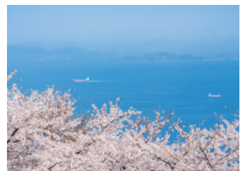
山頂から見える風景(2023年3月)