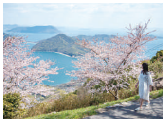
山頂付近の遊歩道