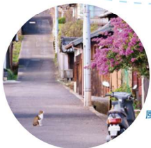
素朴な島の 風景にいやされる