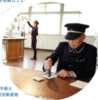
届かない手紙と 想いが集まる漂流郵便局