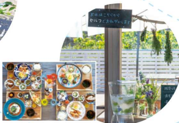
魚料理がおいしい! かわいすぎる島カフェ