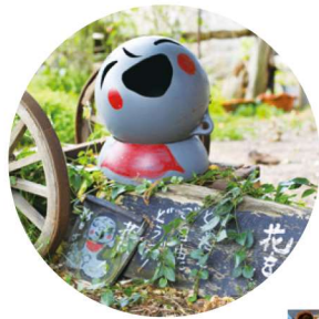
かわいい島の アート作品