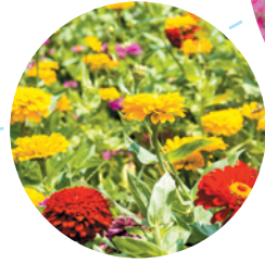
かつては、花の島と呼ばれていた。