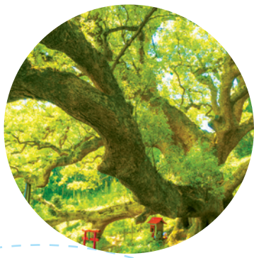
島のシンボル・樹齢1200年の大楠