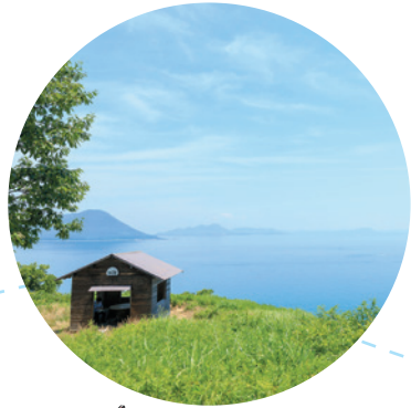
瀬戸内 オーシャンビュー！