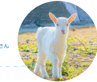
島のアイドルやぎさん