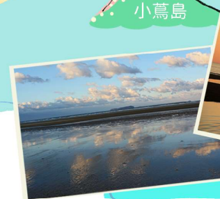
こんな写真はこんなところで!