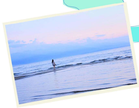
満潮の時にはこんな写真を!