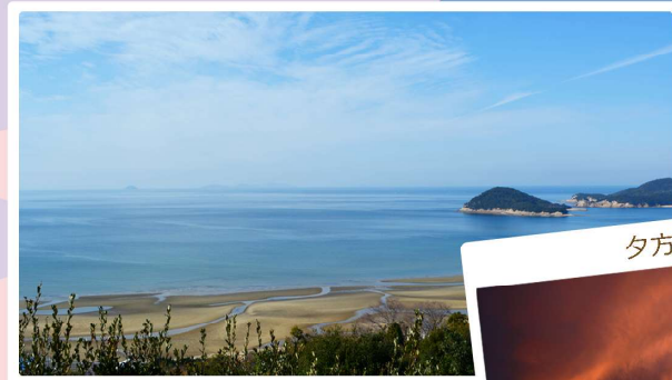
いつもはこんな感じ